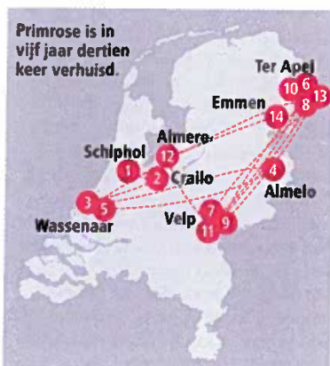
Primrose is in vijf jaar dertien keer verhuisd.